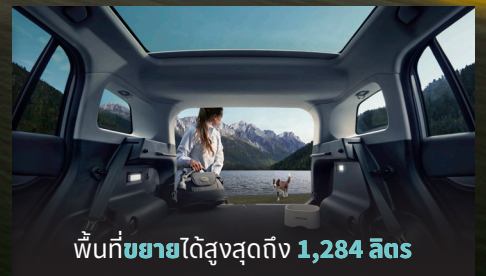
พื้นที่ขยายได้สูงสุดถึง 1,284 ลิตร