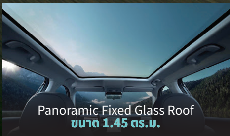
Panoramic Fixed Glass Roof ขนาด 1.45 ตร.ม.