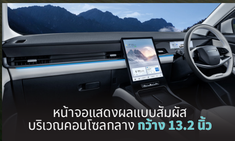
หน้าจอแสดงผลแบบสัมผัส บริเวณคอนโซลกลาง กว้าง 13.2 นิ้ว